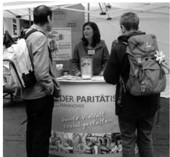
Der Stand des Paritätischen Hannover am Aktionstag.

versche Bündnis, darunter der Paritätische Hannover (Gemeinnützige Gesellschaft für paritätische Sozialarbeit Hannover GmbH), der Sozialverband SOVD, Attac, die Gewerkschaften, einige Parteien und verschiedene Bürgerinitiativen, hatten eine gemeinsame Aktions-