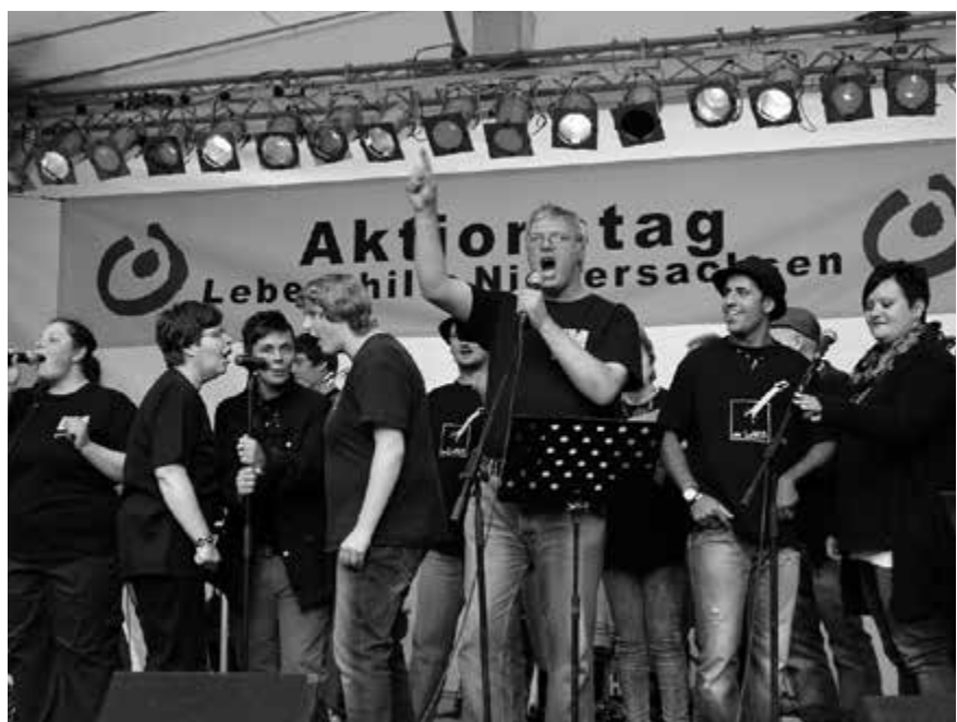
Gute Stimmung auf der Bühne beim Aktionstag der Lebenshilfe Niedersachsen.

Am 15.09.2012 haben am Aktionstag über 5.000 Menschen aus ganz Niedersachsen anlässlich des 50. Jubiläums der Lebenshilfe Niedersachsen ein fröhliches und viel-