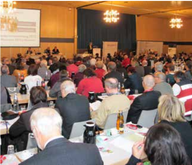
Gut besucht: Die Mitgliederversammlung des Paritätischen Niedersachsen im HCC.