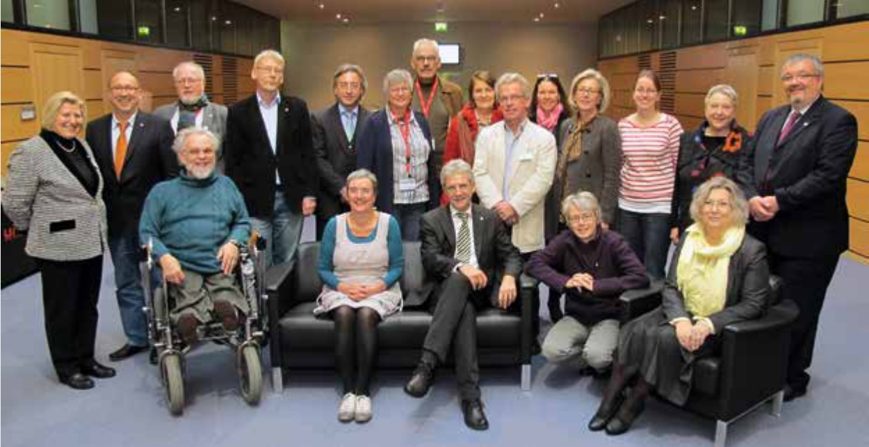
Der neu gewählte Verbandsrat mit dem hauptamtlichen Vorstand des Paritätischen Wohlfahrtsverbands Niedersachsen e. V.

Im Rahmen der Mitgliederversammlung haben die Mitgliedsorganisationen des Paritätischen Niedersachsen einen neuen Verbandsrat gewählt. Das ehrenamtlich besetzte Gremium besteht aus neun Frauen und neun Männern, die den hauptamtlichen Vorstand des Wohlfahrtsverbandes berufen, unterstützen, seine Arbeit kontrollieren und die Interessen der Mitgliedsorganisationen vertreten. Der neue Verbandsrat ist für vier Jahre gewählt. Die gewählten Mitglieder des Verbandsrates sind: