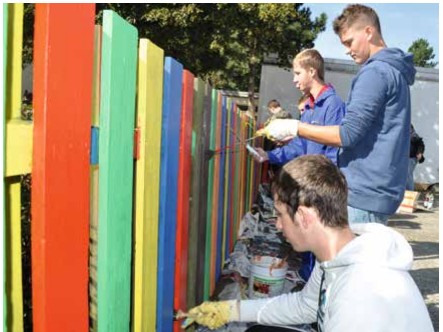
Fleißig: In der Kindertagesstätte in Braunschweig-Broitzem streichen Auszubildende der Firma Bühler den Zaun am Außengelände.