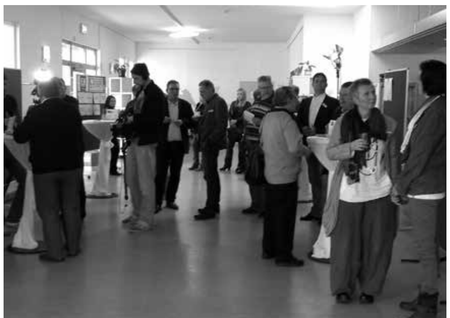
Das „Job-Speed-Dating“ in Hameln.

„Allianz 50plus“ ist der Beschäftigungspakt für Ältere im Landkreis Hameln-Pyrmont. Es ist ein regionales Netzwerk zur Aktivierung und Integration von älteren Langzeitarbeitslosen und wird im Rahmen des Bundesprogramms „Perspektive 50plus“ unterstützt und gefördert. Aufgrund der demografischen Entwicklung in Deutschland wird zukünftig eine längere Lebensarbeitsdauer für Arbeitnehmer/-innen erforderlich sein. Ausgehend von dieser Situation wird die Eingliederung älterer Arbeitsloser notwendig, aber auch Erfolg versprechender. Unter dem Credo „Jeder Mensch