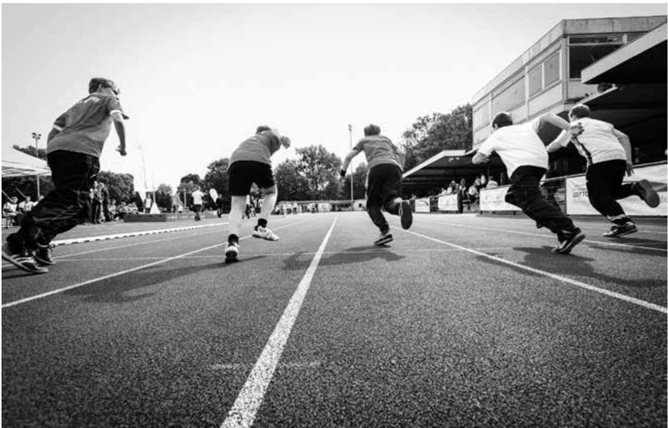
Auf die Plätze - fertig - los! Beim 2. Special Olympics Sportfest in Hannover maßen sich die Athletinnen und Athleten im Erika-Fisch-Stadion unter anderen in den Leichtathletik-Disziplinen Laufen, Weitspring, Weitwurf und Kugelstoßen