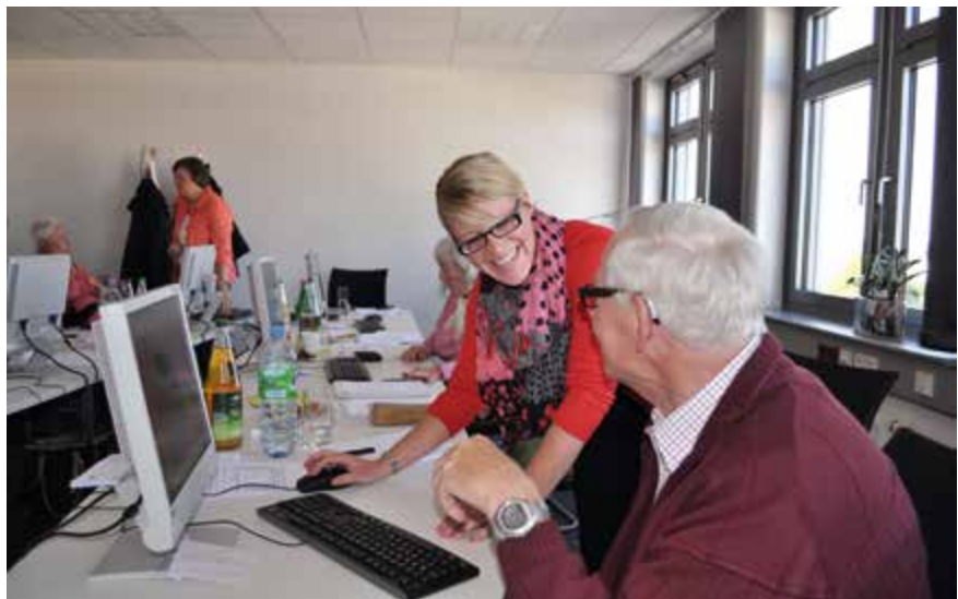
MitarbeiterInnen der Firma eck*cellent IT bringen verschiedenen Braunschweiger Selbsthilfegruppen und der Kibis, Kontaktstelle für Selbsthilfe, den Umgang mit Powerpoint näher.

In der Paritätischen Kindertagesstätte in Braunschweig-Broitzem rückten gleich zwei Unternehmenspartner an, um der Kita einen bunten Anstrich zu verleihen.