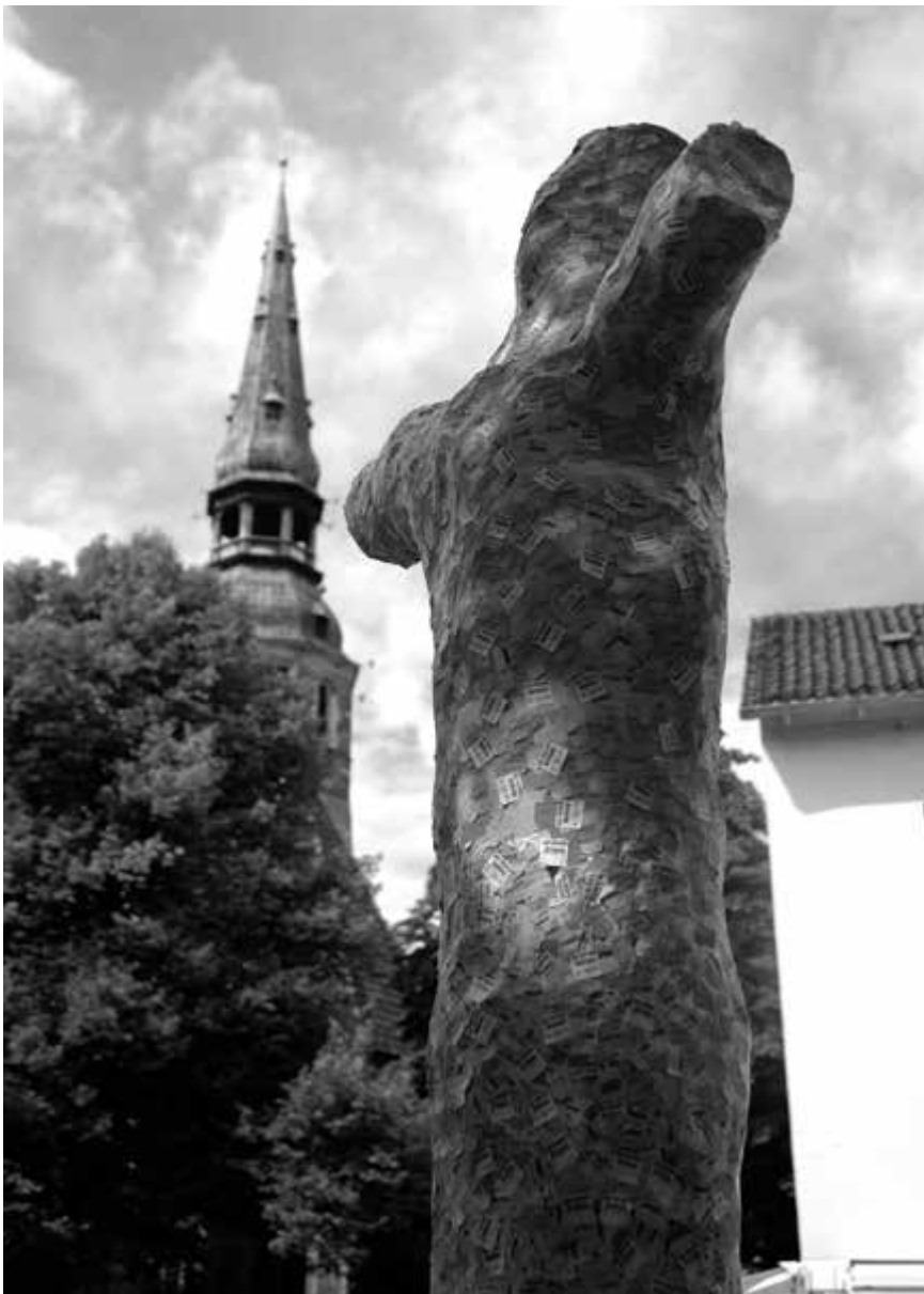
Teil der Kunstaktion: Ein „Etikettenbaum“ in der hannoverschen Innenstadt.

„Das Projekt Strich-Code ist auf vorwiegend positive Resonanz bis hin zur Euphorie gestoßen. Der spielerische Einstieg in ein schwieriges Thema hat sich als glücklich erwiesen, da sich viele Menschen dadurch sehr konkret mit dem Thema auseinandergesetzt haben. Wir haben es geschafft, das Thema Prostitution auch mal von einer anderen Seite als in der Presse üblich zu zeigen, ohne es zu trivialisieren. Die Besucher von Strich-Code lassen sich in drei Gruppen einteilen: die erste Gruppe war die Gruppe der Kunst-Interessierten; die zweite Gruppe waren die, für die der soziale Aspekt im Vordergrund stand; die dritte Gruppe bestand aus den Voyeuren. Betrachtet man die Pressearbeit, so ist festzuhalten, dass die Schwarmkunst von den Medien meistens positiv und auch in großem Ausmaß beleuchtet wurde. Auch der soziale Aspekt fand einen großen Nachhall in den Medien. Die Künstler und die Kunst kamen im Gegensatz zu den beiden ersten Punkten jedoch in der Presse eindeutig zu