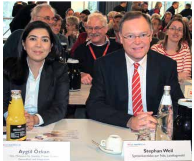
Die Niedersächsische Sozialministerin Aygül Özkan, CDU, und Stephan Weil, SPD-Spitzenkandidat zur Landtagswahl 2013.

mismus – Bunte Vielfalt sozial gestalten!“ heißt die Resolution, die auf der 34. Mitgliederversammlung des Paritätischen verabschiedet wurde.